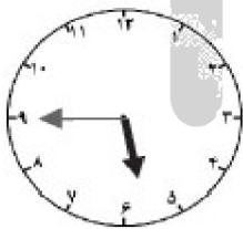
الْسَّادِسَةُ إِلَّا رُبْعاً

عقربه‌های ساعت را رسم کنید. (در امتحانات عقربه ساعت‌شمار را کوتاه‌تر و درشت‌تر و عقربه‌ی دقیقه‌شمار را بلندتر و نازک‌تر بکشید.)