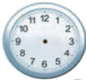
الْسَّادِسَةُ إِلَّا رُبْعاً