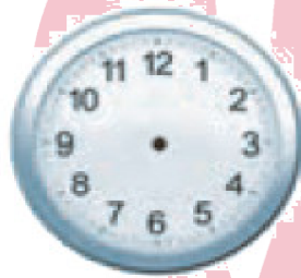
الثَّامِنَةُ وَ النِّصْفُ