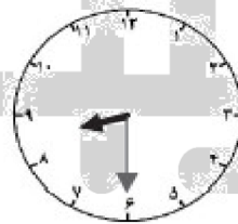
الثَّامِنَةُ وَ النِّصْفُ