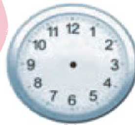
الْخَامِسَةُ وَ الرُّبْعُ